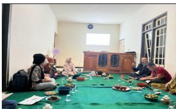
Gambar 3. Penyuluhan Hasil Identifikasi

Fosfat yang tersedia dalam jumlah cukup akan meningkatkan perkembangan sistem perakaran, melalui peningkatan volume atau kepadatan akar. Hal ini sangat membantu absorpsi unsur hara menjadi lebih optimal. Penambahan 50% fosfat pada fase vegetatif (saat pupuk susulan kedua) menjadikan fosfat berperan penuh sebagai energy transporter (pengangkut energi) berupa ATP untuk pertumbuhan sel. Peningkatan massa sel memberikan dampak pada lebar daun walaupun secara statistik berbeda tidak nyata dengan perlakuan mikoriza, trichoderma, maupun kontrol. Semakin lebar daun yang digunakan untuk area fotosintesis, maka semakin banyak pula fotosintat yang dihasilkan. Hal ini menjadikan fotosintat yang dialirkan pada organ penyimpanan semakin banyak pula.