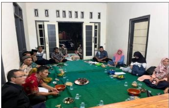
Gambar 4. Penyuluhan Implementasi Perombak Fosfat di Lahan

Dalam menghadapi dinamika lingkungan dan perubahan musim, manajemen risiko pertanian di Desa Pontang dipengaruhi oleh karakteristik unik dari unsur hara tanah itu sendiri. Berbeda dengan nitrogen yang mudah larut oleh air hujan, kandungan fosfat di dalam tanah sama sekali tidak dikendalikan oleh musim kemarau maupun penghujan, melainkan dikendalikan oleh tingkat keasaman (pH) tanah. Jika kondisi pH tanah terlalu asam, pupuk fosfat akan mengendap dan tidak dapat bercampur dengan baik kecuali dinetralkan melalui proses penggenangan lahan. Untuk meniyasati risiko kegagalan, para petani menerapkan strategi pola tanam tumpang sari dengan komoditas seperti kacang-kacangan, buncis mitra, dan cabai dalam satu hamparan. Mereka juga mengandalkan sumur bor sebagai sumber pengairan utama serta memprioritaskan pembelian benih berkualitas langsung dari kios resmi. Jika diurutkan, kendala utama yang sering dihadapi di lapangan meliputi jarak tanam, kepastian persediaan pupuk bersubsidi, hingga kelangkaan tenaga kerja. Sebagai langkah penanganan dampak ( ex-post ), petani memilih opsi meminjam modal jika mengalami kerugian, tetap menanam jagung pada musim yang aman, serta sebagian kecil mulai bergantung pada pertanian semi organik.