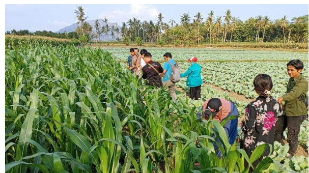
Gambar 1. Identifikasi Existing Lahan Budidaya Jagung

Dosis yang disarankan dalam penggunaan fosfat (Pupuk P) yaitu 50% dari dosis yang selama ini digunakan petani. Hal ini akan mengakibatkan akar lebih lebat sehingga tanaman dapat menyerap unsur hara dengan optimal. Pemupukan kedua menyebabkan daun menjadi lebar. Jika penggunaan pupuk antara 50 kg sampai 100 kg akan menghasilkan produksi sebesar 9,05 ton. Jika penggunaan pupuk lebih dari 100kg akan menghasilkan produksi jagung sebesar 12 ton. Dari kedua pilihan penggunaan pupuk adalah tergantung dari kebutuhan dan modal petani, jika petani yang memiliki modal besar bisa menggunakan penggunaan pupuk 100%, namun jika petani yang memiliki keterbatasan modal dapat menggunakan pilihan penggunaan pupuk fosfat dengan dosis 50%. Oleh karena itu, pentingnya penambahan fungsi perombak fosfat terhadap produktivitas tanaman jagung pada lahan-lahan yang teridentifikasi banyak mengandung fosfat.